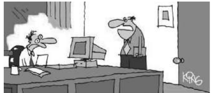
Debería mirar el correo electrónico más a menudo... ¡Hace tres semanas que le despedí!