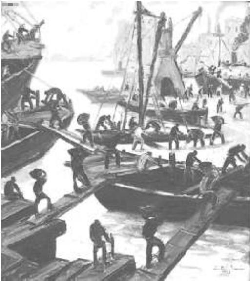
“Trabajando en un día gris”

Nació el primero de marzo de 1890 en Buenos Aires y falleció el 28 de Enero de 1977. Sus pinturas de escenas portuarias reflejan una fuerte expresión de actividad, de vigor y de aspereza como muestra de la vida en la zona de la Boca. También pintó numerosos murales y cerámicas de grandes dimensiones en edificios públicos, oficiales y en instituciones privadas. Fue el pintor del Riachuelo por excelencia, y el más popular de los pintores argentinos. Su obra figura en los mejores museos de arte de Europa y América.