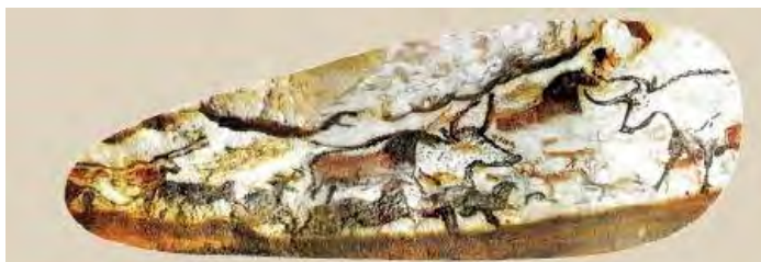
"Ronda de los toros", pintura rupestre de la sala principal de la cueva de Lascaux.

Con el tiempo, aumentó mucho el número de miembros de esa comunidad. Entonces, los recursos (comida, agua) que tenían alrededor del lugar donde vivían comenzaron a escasear. Y ese grupo, que ya no era tan pequeño, se dispersó: unos viajaron hacia un lugar y otros hacia otro.