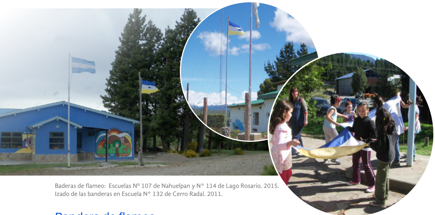
Baderas de flameo: Escuelas N° 107 de Nahuelpan y N° 114 de Lago Rosario. 2015. Izado de las banderas en Escuela N° 132 de Cerro Radal. 2011.

Asimismo, se pueden intercambiar regalos y obsequios para las y los estudiantes y las autoridades presentes, que sean significativos y acompañen en este momento de reafirmación identitaria, y que surjan de los consensos y acuerdos previos con la Comunidad de referencia.