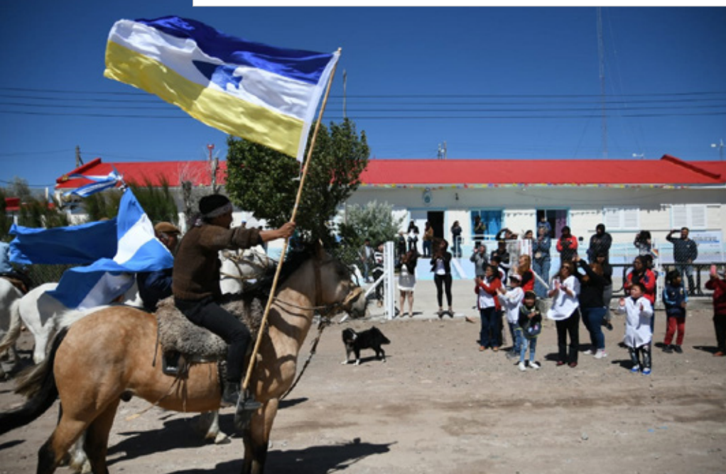
Autoridades y miembros de la Comunidad Originaria de Yala Laubat hacen entrega de un nuevo paño de la Bandera Mapuche-Tehuelche, a la Escuela N° 62, de esa localidad. Año 2022.

La interculturalidad, más que el reflejo de una situación existente, es un proceso, una perspectiva o un proyecto a construir, que consiste no solamente en la convivencia e intercambio de diferentes expresiones culturales, sino que aspira también a que se produzca en términos de respeto y valoración de la diversidad y de búsqueda de la igualdad, lo cual requiere comprender que la cultura hegemónica no es la única. (En: Interculturalidad. Derechos Humanos, Género y ESI en la escuela - 2a ed. - Ciudad Autónoma de Buenos Aires : Ministerio de Educación de la Nación, 2021. P 18).