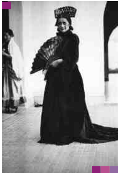
Peinetones y abanicos

[2] Nació en los alrededores de Ginebra (Suiza), en febrero de 1794. En su juventud adquirió conocimientos de dibujo, topografía, cartografía y ciencias naturales. Es probable que llegara al Río de la Plata en 1828, fecha en que anunció por los periódicos la iniciación de su establecimiento litográfico. Editó los cuadernos de los Principios de Dibujo, primeros materiales didácticos conocidos en el país. Entre otras obras inició en 1830, la publicación de la obra Trages y costumbres de la Provincia de Buenos Aires, de la que sólo aparecieron tres láminas: Gaucho, Repartidor de pan y lechero; grabó y editó planos topográficos, mapas. El fracaso material de sus trabajos lo decidió a alejarse del país, y ofreció sus servicios a los gobiernos de Bolivia y Chile. Obtuvo un contrato ventajoso para fundar la imprenta y litografía del Estado. Regresó a Buenos Aires a fin de preparar su partida definitiva. Esta situación molestó mucho a Rosas, y se agregó la denuncia que se hizo de su vinculación política con Rivadavia, por en marzo de 1837, fue detenido y se lo llevó al Cuartel del Retiro. Intervino el cónsul de Francia en su defensa. A fines de 1837, después de repetidas instancias, y cuando el preso casi había perdido la razón, se lo dejó en libertad sin explicación alguna. Con la salud destrozada, falleció en su casa, el 4 de enero de 1838, protestando su inocencia. Su esposa e hijos, desesperados y en la miseria, se embarcaron para Europa, el 2 de marzo del mismo año.