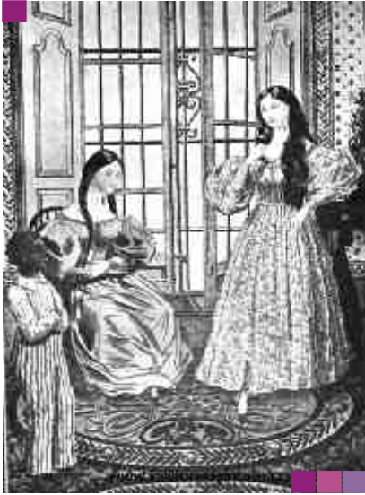
Señora porteña por la mañana